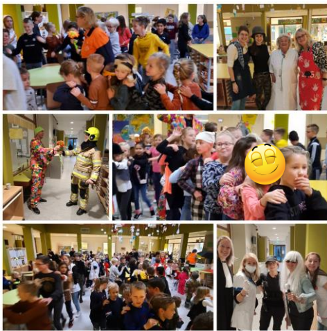
De opening: Een beroepenpolonaise door de hele school.

Hieronder een impressie van de activiteiten die hebben plaatsgevonden: