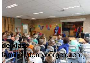
de klas familieleden voorgelezen.

familie en daar horen natuurlijk opa's en oma's bij. Wat ontzettend leuk om te zien dat er veel opa's en oma's zich hebben ingeschreven voor het voorlezen in de groep van hun kleinkind.